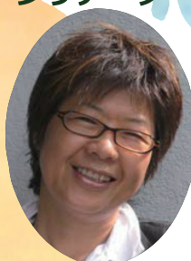
情報の輪サービス 株式会社 代表取締役

短大卒業後、銀行の人事に所属し、顧客サービス、コンサルタント業務に携わる。その後、大手研究所や総合商社勤務を経て、Hiyoshi・マネジメント・オフィスを設立。主に女性の就労支援の問題に取り組み、パソコン講習、キャリアデザイン、ライフプラン等の講習を行う。