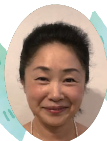
Hiyoshi マネジメント・オフィス 代表